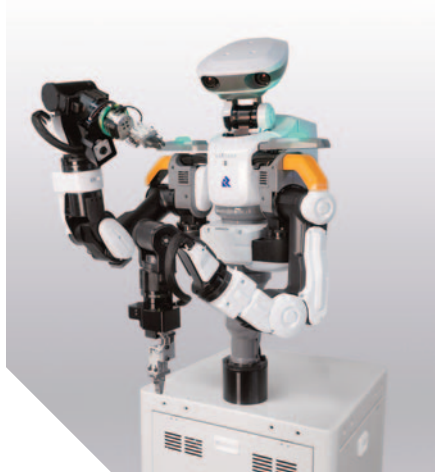
Le robot Kawada en action

Le robot Nextage est un type de robot humanoïde pouvant exécuter des tâches dans des endroits habituellement difficiles pour des robots traditionnels. Avec sa géométrie ressemblant à un être humain et ses quatre caméras, il peut facilement s'intégrer dans un flux de travail standard sans que l'utilisateur n'ait besoin de reconcevoir ses lignes de production. Il est capable de réaliser de nombreuses tâches cycliques comme des opérations de mesures, de gravage et bien d'autres encore. Il peut également tourner sur lui-même et est capable de changer ses préhenseurs, ce qui lui permet de réaliser davantage d'opérations de manipulation sur une même place de travail. Les robots Nextage sont fabriqués par Kawada Robotics