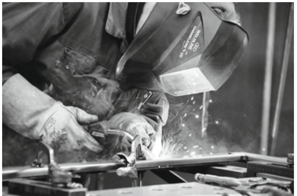
La précision est aussi de mise dans le soudage chez Patric Metal SA aux Geneveys-sur-Coffrane.