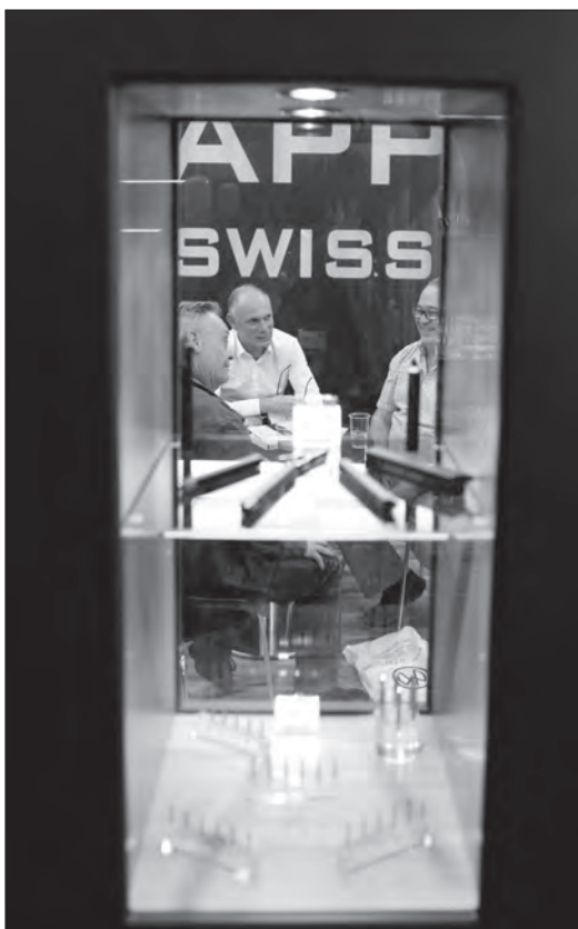
A travers la lucarne...