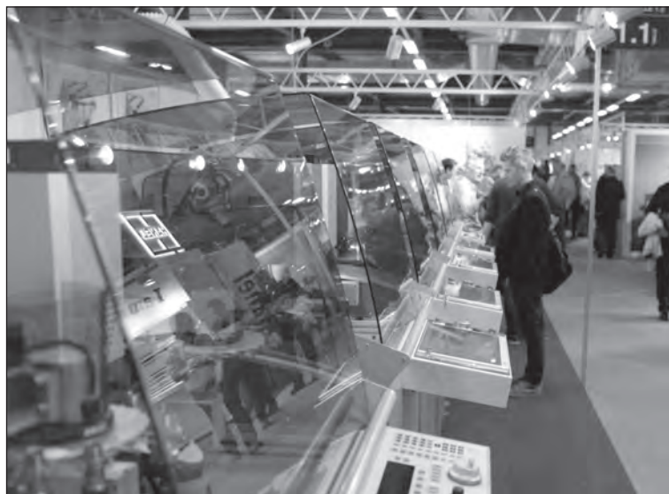
La cloche de verre protège des éclaboussures.