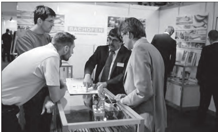
Discussion entre spécialistes