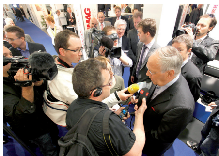
SIAMS – Un salon important qui attire des visiteurs importants. En 2012, le conseiller fédéral Johann Schneider-Ammann s'est déplacé

Le SIAMS est divisé en domaines thématiques : machines, équipements, automatisation, outils-accessoires-mécanique, matières premières, produits semi-finis, transformation des métaux et matières plastiques, sous-traitance, travaux d'assemblage, entreprises de services et organisations.