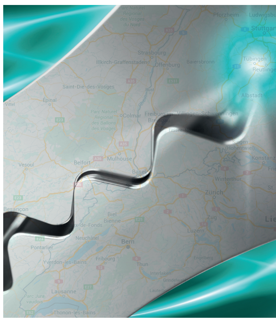
L'Arc jurassien aujourd'hui : du Jura français jusqu'à Schaffhouse en Forêt noire et à Stuttgart