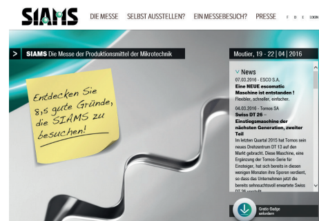
SIAMS – Site utile www.siams.ch avec téléchargement de billets gratuits et messages des exposants