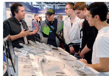
SIAMS – Moins de spectacle et plus d'informations pour les jeunes et les moins jeunes