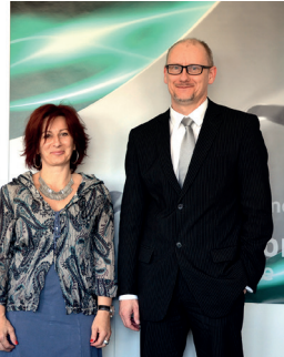
Organisation : Laurence Gygax et Pierre-Yves Kohler