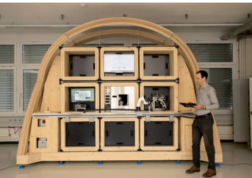
La micro-usine intelligente de demain

Une halte bienvenue au sein du MicroLean Lab de la Haute Ecole Arc. Avec ce prototype de micro-usine, les entreprises partenaires de ce projet entrevoient de transformer graduellement leur outil de production par des micro-usines. Imaginez une armoire constituée de briques technologiques communiquant entre elles et choisies en fonction de la pièce à réaliser. Un horloger qui souhaiterait réaliser ses kits platine-ponts garnis et décorés aurait accès à une micro-usine comprenant neuf briques technologiques reliées par une transitique dédiée et supervisées par un système de gestion intelligent.