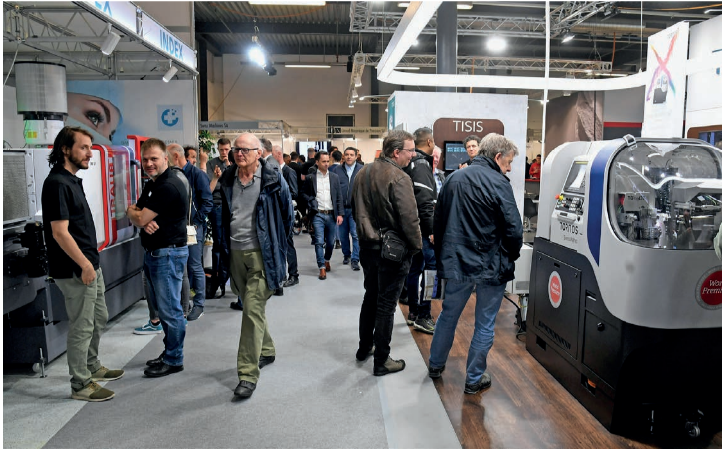
Le SIAMS est aussi une occasion de partager et d'échanger entre spécialistes de l'industrie microtechnique.

«Dès 2020, nous avons entamé une réflexion sur l'orientation à donner à i-moutier,