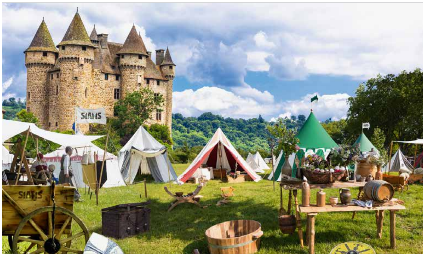
Die Messe ist wahrscheinlich das älteste zur breiten Vermarktung von Produkten und Dienstleistungen eingesetzte Medium, und muss sich ständig neu erfinden. Im Bild der SIAMS 999 am Vorabend ihrer Eröffnung (Fake-Bild).

die sich in unserer Region und darüber hinaus in der gesamten Welt der Mikrotechnik entwickelt haben. Und da diese Lösungen weit herum gültig sind, gelten sie auch für lokale Unternehmen, die oft feststellen müssen, dass sie Kompetenzen und Produkte in der Ferne gesucht haben, die durchaus regional verfügbar sind.