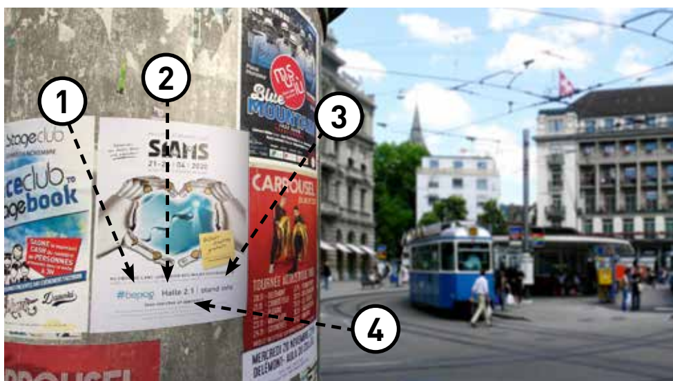
Während Poster ganz allgemein noch etwas Wirkung zeigen, bieten die von SIAMS 2020 viel mehr! Sie können von den Kunden der Veranstaltung selbst angepasst werden. (① Logo, ② Halle, ③ Stand und ④ Schlüsselbegriff).

Mit der Version 2019 des Informationsportals werden Stellenangebote besser beworben, aber je nach Struktur der Unternehmen ist die Person, die hier möglicherweise ein Stellenangebot veröffentlicht, nicht die gleiche wie die, die sich mit Kommunikation im Zusammenhang mit der SIAMS beschäftigt. Um hier Abhilfe zu schaffen, haben Sie neu die Möglichkeit, ein zusätzliches Login für die Personalabteilung zu erstellen, so dass eine andere Person, z.B.