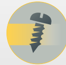
Système d'inclinaison Sylvac exclusif, pour de meilleures mesures de filetages.