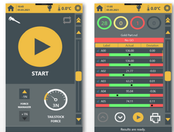
Nouvelle interface opérateur à écran tactile, facile à utiliser.