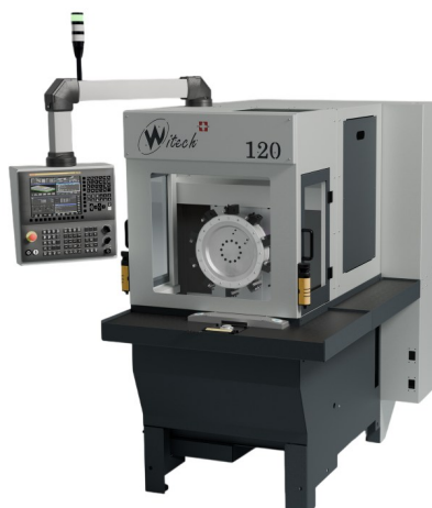
Tour verticale 3 axes