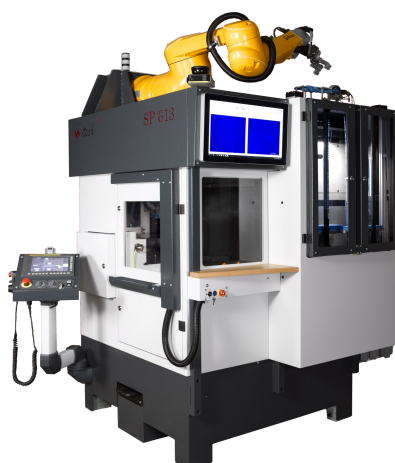
Centre d'usinage multiaxes robotisé