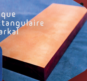
Plaque rectangulaire Sparkal