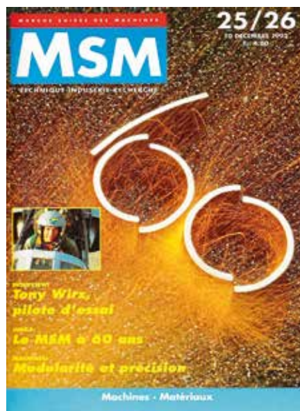
Le numéro spécial du soixantième anniversaire du MSM de décembre 1992.