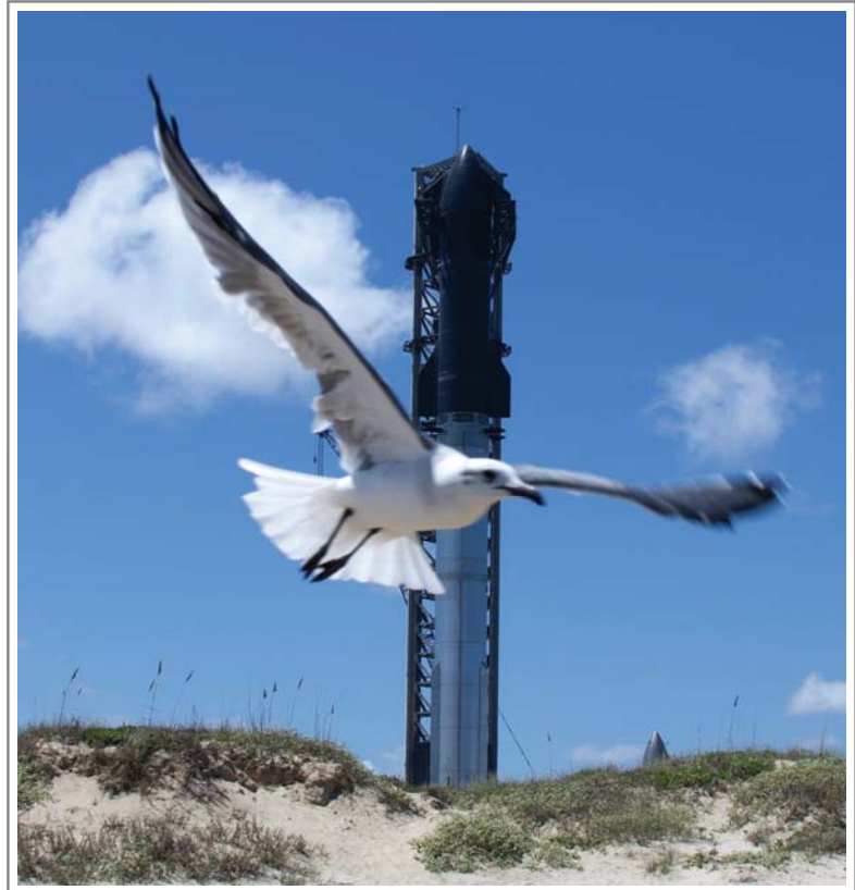
Un albatros survole la fusée de SpaceX Starship à Boca Chica (TX) - 14.9.2023