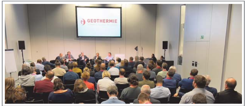
Congrès suisse de la géothermie - Bâle 5 octobre 2023