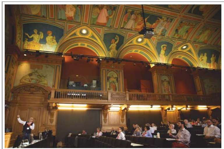
Journée de la Technique de Swiss Engineering. Palais de Rumine, Lausanne. - 27 septembre 2023