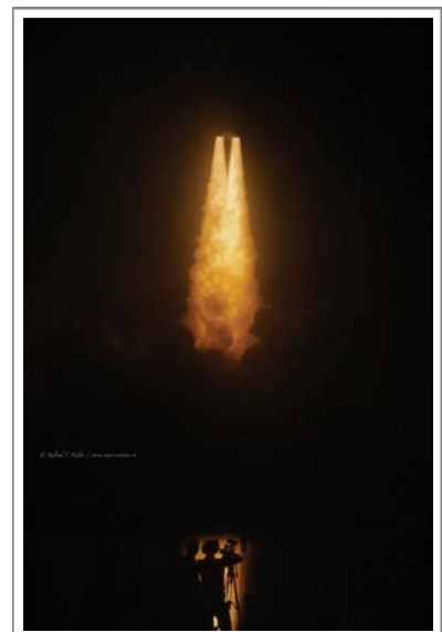
Décollage d'Artemis 1 de Cap Canaveral le 16 novembre 2022

J'essaie de capturer non seulement le spectacle technique, mais aussi l'émotion collective qui l'entoure. Une invitation à partager ma passion et à ressentir la magie de ces moments uniques.