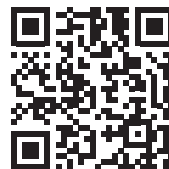
MEDIA KIT 2026 BULLETIN D'INFORMATIONS