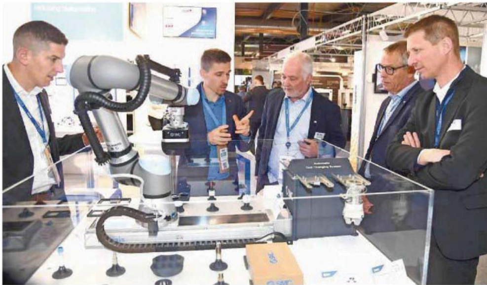
Il y a du monde dans les allées. Les visiteurs ne boudent visiblement pas cette 19 e édition du SIAMS.

Dans les allées du salon, complet avec ses 454 exposants, on était parfois pas loin de devoir jouer des coudes pour passer. «Contrairement au climat économique, l'ambiance est très bonne ici, il y a bien du monde», constate Dou-