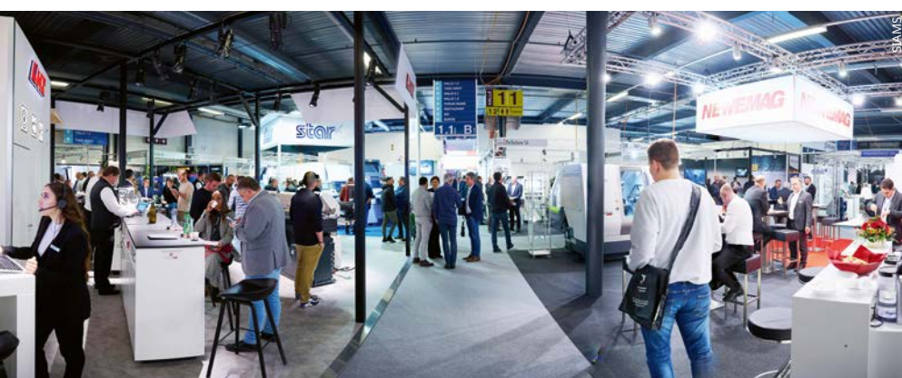
Die Fachmesse SIAMS bringt auch Akteure aus den Bereichen Mikromechanik und Drehteilfertigung zusammen, die die Schweizer Uhrenindustrie beliefern.

Hinter den grossen Marken, die in den internationalen Schaufenstern dominieren, stützt sich die Schweizer Uhrenindustrie auf ein dichtes Netz industrieller Zulieferbetriebe, das weitgehend im Jurabogen konzentriert ist. Drehteilhersteller, Spezialisten für Präzisionsbearbeitung, Hersteller von Komponenten oder Werkzeugen: Diese KMU bilden die eigentliche technische Infrastruktur der Branche.