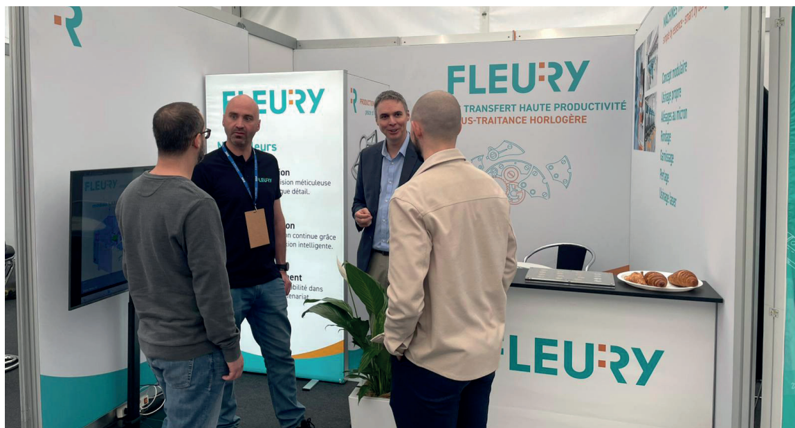
C'est une nouvelle fois une ambiance empreinte de convivialité qui a régné sur les stands des entreprises exposantes.

Avec une fréquentation quasiment équivalente à 2024, le SIAMS 2026 confirme son statut de Salon incontournable dans le domaine de la microtechnique. Cerise sur le gâteau, tout au long de la semaine les hôtes et hôtesse ont déjà réceptionné une centaine de formulaires d'intentions pour 2028. Comme d'habitude, les organisateurs mettront rapidement en place un questionnaire et fixeront une séance de débriefing avec les exposants pour les améliorations à apporter dans le futur. Les visiteurs ont également pu répondre à un questionnaire d'amélioration qui donnera de précieuses indications.